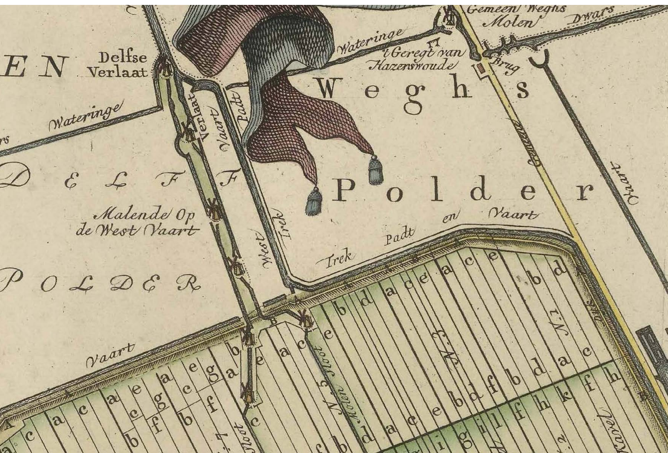
De molens en de ringvaart van de droogmakerij