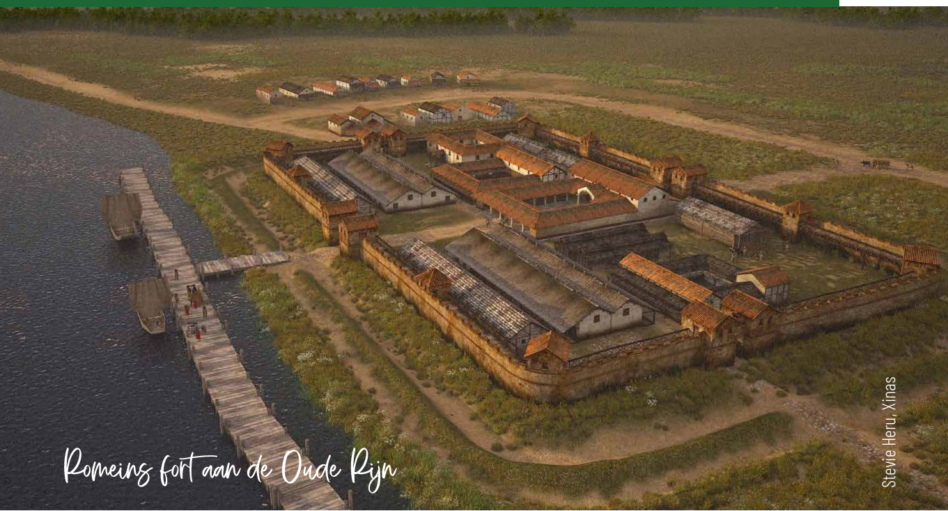
Romeins fort aan de Oude Rijn

Ga op de kruising linksaf (Lagewaard). Sla na 300 m bij wandelknooppunt 53 linksaf. Volg het fietspad tot het einde.