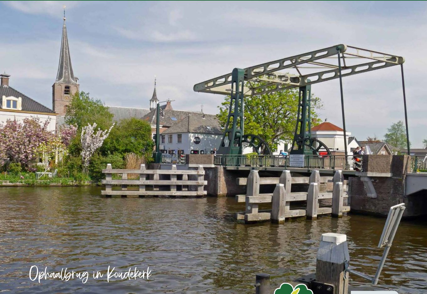
Ophaalbrug in Koudekerk