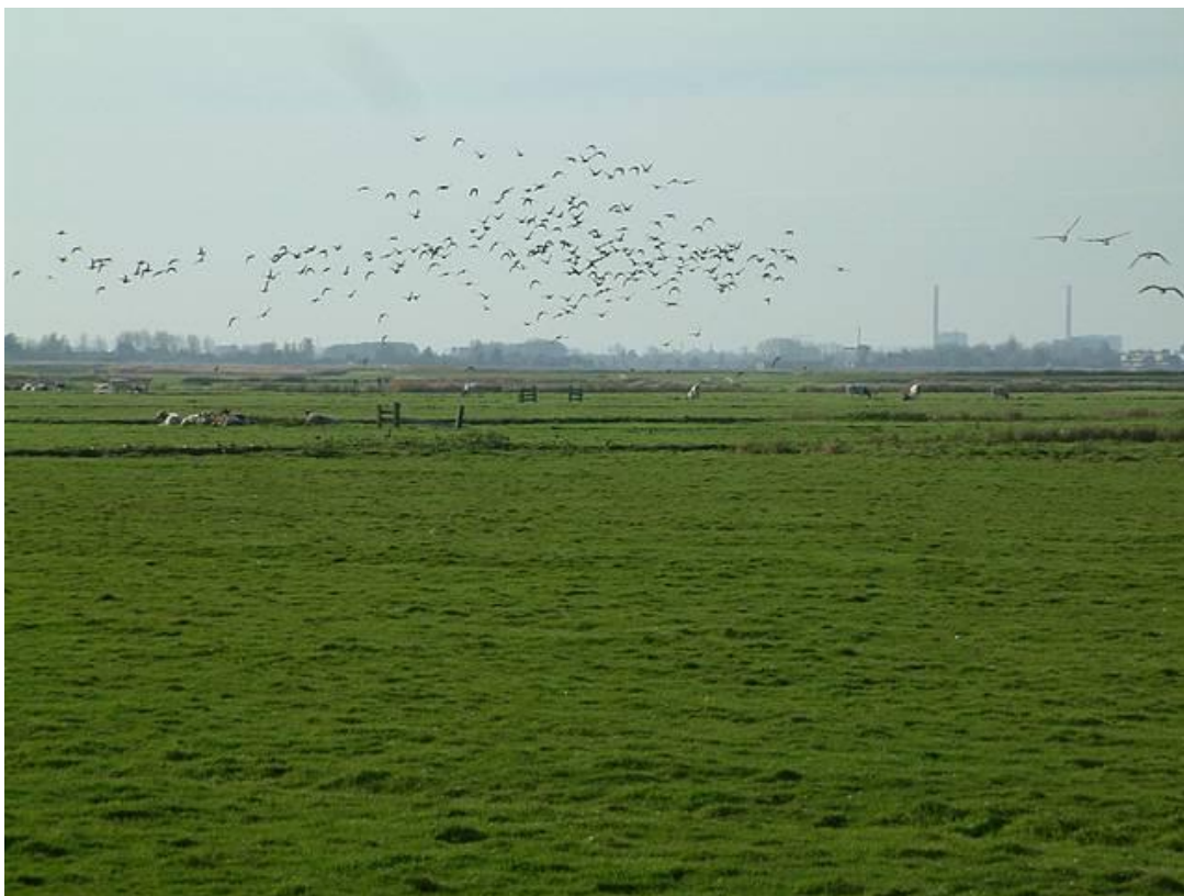
Weidevogellandschap ( https://nl.wikipedia.org/wiki/Weidevogel )

Voor Kievieten zijn een aantal pakketten met een vroegere rustperiode geschikt (vanaf 15 maart), de rustperiode loopt voor Kievieten ook eerder af, uiteraard alleen als er geen opgroeiende kuikens, ook niet van andere soorten, aanwezig zijn.