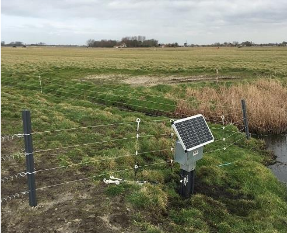
Vossenraster, collectief Water, Land en Dijken

Predatierasters om grondpredatoren te weren moeten worden onderhouden: gras onder het raster wegmaaien en het raster controleren op draden en spanning. Rasters staan veelal om een aantal beheereenheden met weidevogelmaatregelen geplaatst. De vergoeding voor het pakket betreft het plaatsen, onderhouden en weer verwijderen van het raster. Het is belangrijk je goed te laten informeren over het type raster, de plaatsing en het onderhoud zodat het past bij het mozaïek en de doelsoorten. Het (onderhoud van het) raster mag de rust op het perceel niet verstoren.