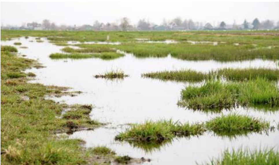
Plas dras in Krimpenerwaard

Het pakket met startdatum 15 februari heeft als voordeel dat de plasdras aanwezig is bij de start van het weidevogelseizoen, het pakket met startdatum 1 maart biedt een langere tijd voor de ontwikkeling van de bodemfauna. De plasdrassen in de periode mei-augustus hebben een functie als opvethabitat voor de vogels. De plasdras in november-december is bedoeld voor overwinterende soorten zoals de Kleine zwaan.