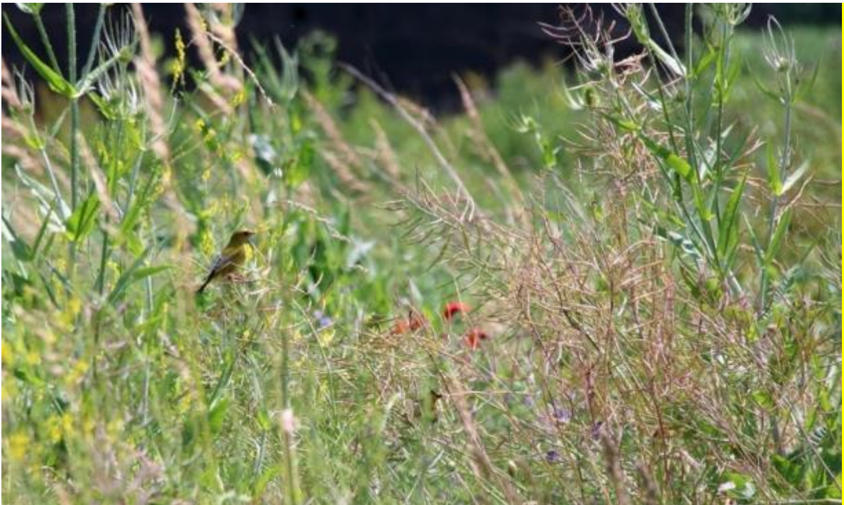
Bloemenblok in de zomer

Bloemenblokken bieden voedsel, veiligheid en voortplantingshabitat. Vogels vinden er veilige broedgelegenschap en voedsel voor kuikens. Patrijzenkuikens en jongen van andere boerenlandvogels eten in de eerste twee weken van hun leven voornamelijk insecten. Dit eiwitrijke voedsel is essentieel voor de groei van kuikens. Daarnaast is er volop zaad te vinden in de herfst en winter én bladgroen aan het einde van de winter als de zaden op raken. Bovendien biedt de begroeiing dekking tegen predatoren en slechte weersomstandigheden. Naast patrijzen zijn er nog vele andere vogelsoorten die van een bloemenblok kunnen profiteren. Ook vlinders, bijen en hommels profiteren van het grote aanbod van bloemen.