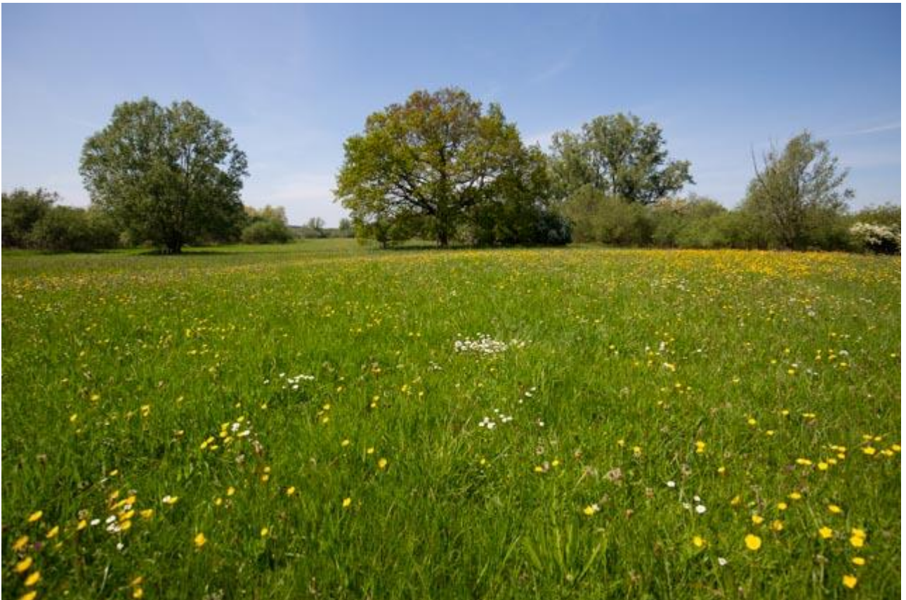
Botanisch grasland

Doelsoorten van de leefgebieden droge dooradering en open grasland waarvoor botanisch grasland meerwaarde heeft, onder andere: graspieper, patrijs, veldleeuwerik. Ook de kwartelkoning maakt gebruik van deze graslanden. Deze vogel broedt van ca. mei tot augustus, daarom is een rustperiode vanaf medio juni tot later in de zomer gewenst, dit kan via de pakketvarianten met rustperiode.