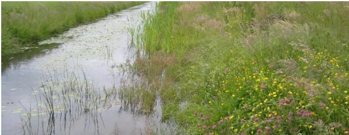
Natuurvriendelijke oever

Natuurvriendelijke oevers beschermen tegen afkalven van de oever. Door, bijvoorbeeld, drinkbakken te plaatsen, voorkom je vertrapping van de oever door vee. Dat helpt om te voorkomen dat veen 'weglekt' naar de sloot en wordt extra slibvorming voorkomen. Slib in veensloten is een belangrijke bron van methaanuitstoot. Natuurvriendelijke oevers dragen daardoor bij aan klimaatmitigatie omdat slibvorming en daarmee methaanuitstoot voorkomen wordt.