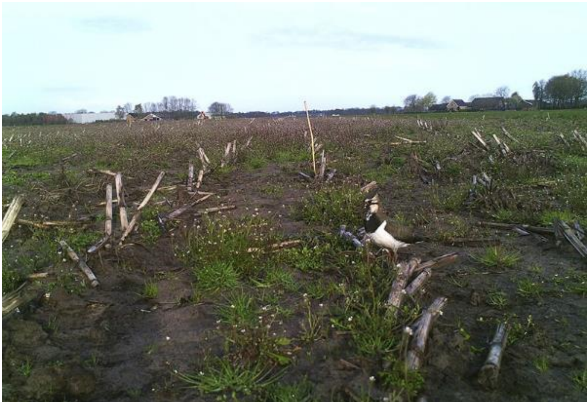
Kievit op bouwland met uitgesteld zaaien, fragment

Contact met veldmedewerkers en/of vrijwilligers is erg belangrijk. Zij brengen de nesten en kuikens in kaart, waarbij zoveel mogelijk vanaf de rand van het perceel gemonitord wordt. Nesten worden geregistreerd, het liefst digitaal. Nesten worden beschermd tegen verstoring via verplaatsen, nestbeschermers of via uitstellen van zaaien van het gewas.