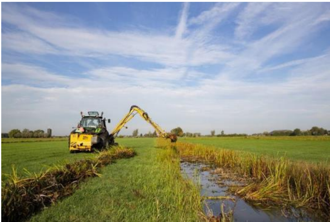
Ecologisch slootschonen

Ten behoeve van de flora en fauna in de sloot blijft ieder jaar een deel van de vegetatie in de sloot staan, het is dus niet aan te raden om iedere sloot in het gebied volledig te schonen. Baggerspuiten is bedoeld om delen van de sloot op diepte te houden. In dit beheerpakket moet dat met de baggerpomp, niet met de maaikorf, omdat dan de bodemvegetatie te veel beschadigd wordt.