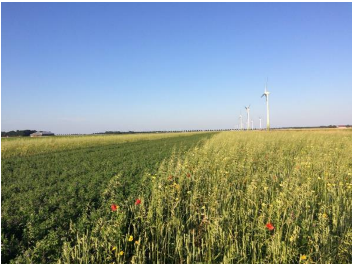
Vogelakker in Flevoland, vogelakkers zijn ontwikkeld door de Werkgroep Grauwe Kiekendief

Vogelakkers zijn bedoeld voor muizenetende roofvogels en uilen, maar ook broedende veldleeuweriken en overwinterende akkervogels worden door Vogelakkers aangetrokken. Om goed te functioneren moeten vogelakkers meerdere jaren op dezelfde plek liggen, zodat de muizenpopulatie zich kan opbouwen. Een vogelakker moet na een paar jaar vernieuwd of verplaatst worden. Voor het laatste jaar kan pakketvariant b gebruikt worden, zodat in het najaar de grond bewerkt kan worden.