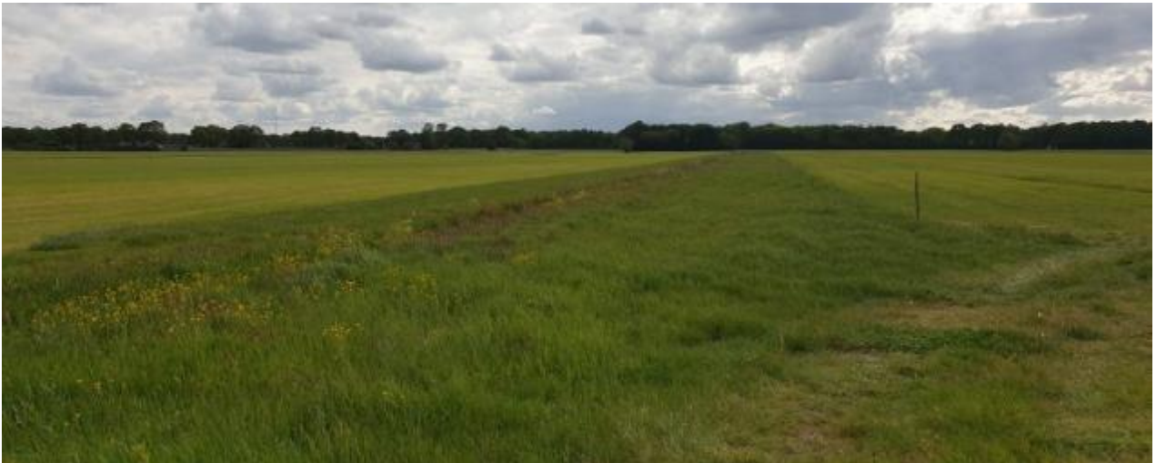
Kuikenveld: strook niet gemaaid gras

De vergoeding voor dit last-minute beheer met uitgesteld maaien begint te lopen vanaf 16 mei. Kuikenvelden worden bij voorkeur beheerd als vervolg op legselbeheer op grasland, registreer ze dan onder pakket 4 – Legselbeheer.