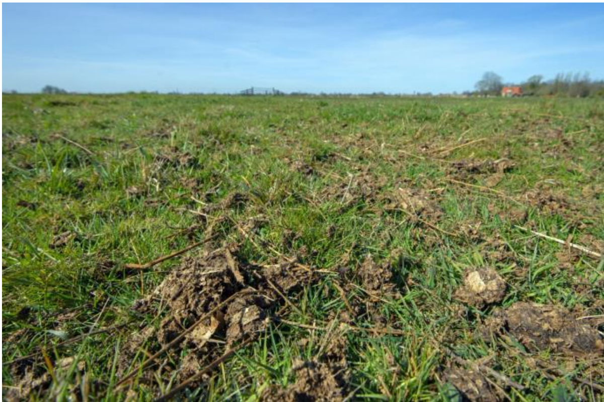
Ruige mest

Dit pakket is specifiek bedoeld voor boerenlandvogelbeheer en kan alleen in combinatie met andere, op broedvogels gerichte pakketten worden afgesloten. In pakketten t.b.v. bodemkwaliteit, water en klimaat is bemesting met ruige mest of andere bodemverbeteraars en plantenresten mogelijk via het pakket Bodemverbetering (pakket 39).