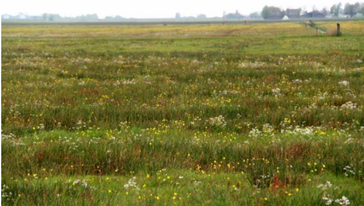
Kruidenrijk grasland

Op kruidenrijke graslanden komen de kruiden van nature in grotere aantallen voor en zijn verspreid over het hele perceel. De zode is open en divers van structuur door de vele kruiden met veel bloei-stengels en weinig blad. Dit heeft ook als voordeel dat kuikens zich goed kunnen voortbewegen in het grasland.